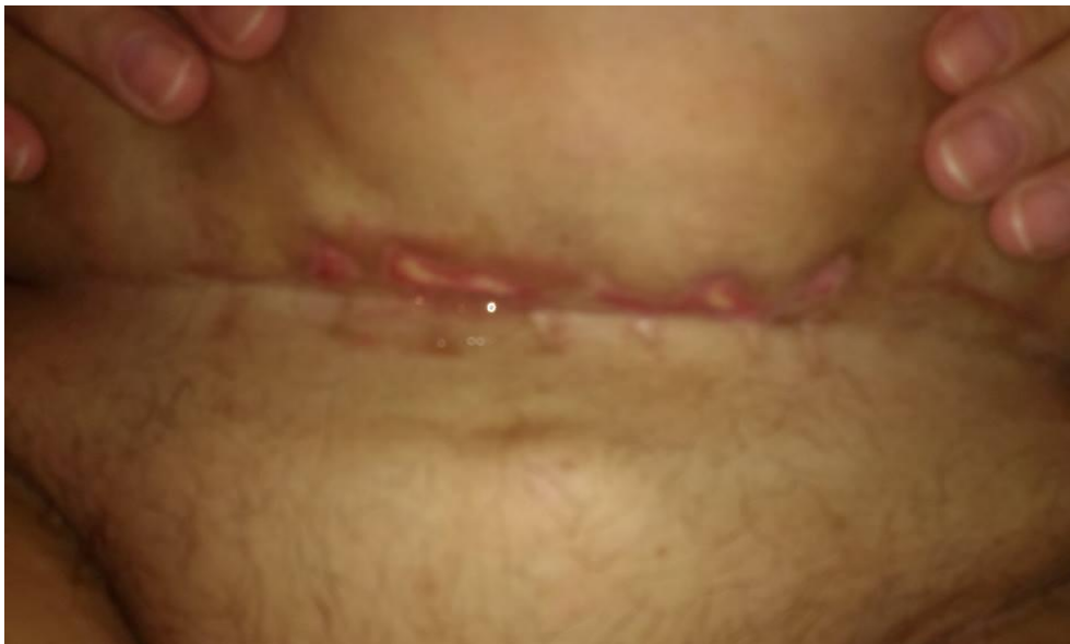
Снимка 2. Изглед на раната след проведеното медикаментозно лечение от проф. д-р Христов