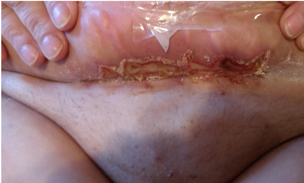
Снимка 1. Изглед на раната след оперативната интервенция на д-р Хубчев и последващото медикаментозно лечение, проведено също от д-р Хубчев